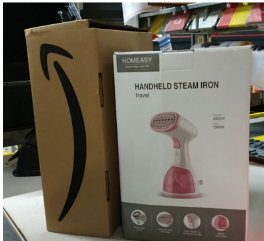
Figure 5 : fer à vapeur à main