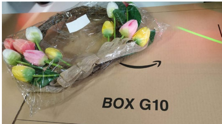
Figure 3 : Couronne des tulipes artificielles