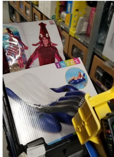
Figure 2 : Flotteur de piscine