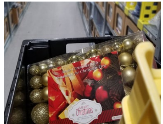
Figure 4 : Ornaments de Noël